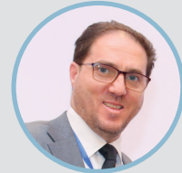
السيد وليد التميمي رئيس المجموعة الرقابية على مكافحة غسل الأموال وتمويل الإرهاب / دائرة الرقابة على مكافحة غسل الأموال وتمويل الإرهاب البنك المركزي الاردني