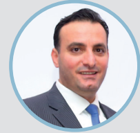
السيد رأفت حماد خبير الرقابة على شركات التأمين البنك المركزي الاردني